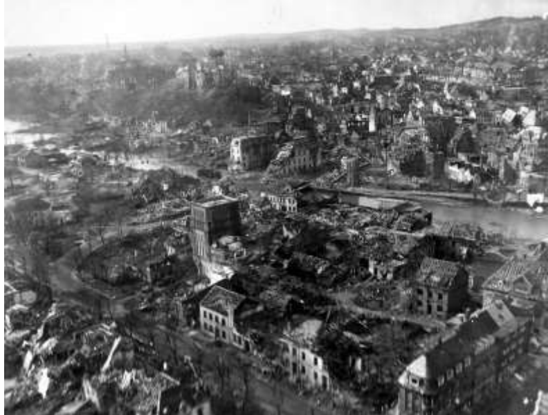
Kleef - 1945

Na vier weken onophoudelijk vechten krijgt het regiment wat rust in Kleef. Hun onderkomen is niet erg luxe, maar ze hebben een dak boven hun hoofd en na alle bombardementen zijn daken schaars in Kleef. De mannen kunnen in bad en er wordt gevolleybald. Wie wil kan met een vrachtwagen op en neer naar Nijmegen voor een bezoekje aan de bioscoop.