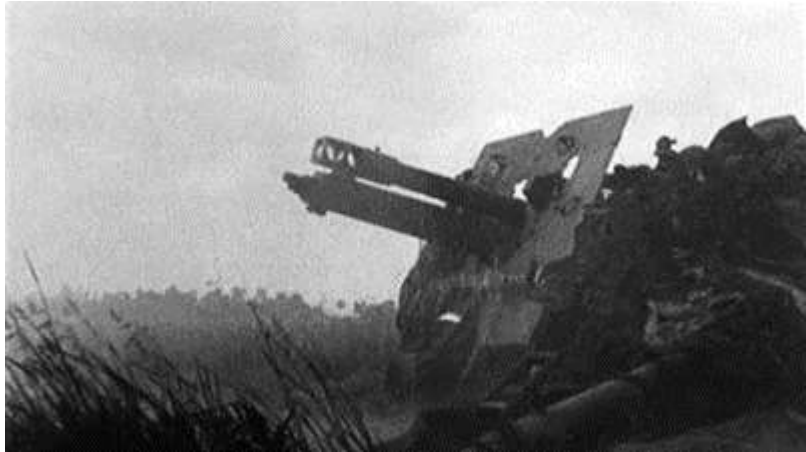
25 Pounder Field Gun

Uiteindelijk weet de 3 rd Canadian Infantry Division, waar het 12 th Field Regiment onderdeel van uitmaakt, de plaatsen Breskens, Oostburg, Zuidzande en Cadzand te bevrijden. Operatie Switchback eindigt op 3 november, de zuidelijke oever van de Schelde is in handen van de geallieerden. Door het constant vechten in onderwater gelopen terrein en modder krijgt het 12 th Field Regiment de bijnaam "De Waterratten".