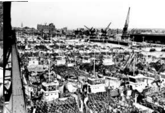
105mm Priest - Southampton - juni 1944

Uiteindelijk landt het regiment, onderdeel van een troepenmacht van veertienduizend Canadezen, op 6 juni om 07.15 uur op Mike Green, een zone op Juno Beach, tussen La Rivière en Courselles-sur-Mer, Frankrijk.