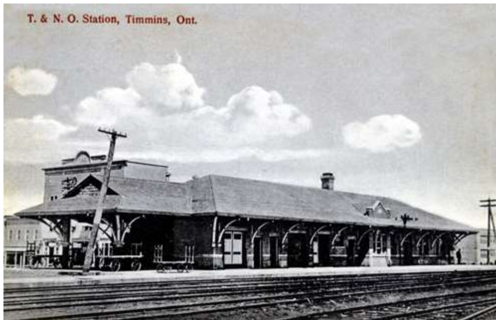
Treinstation in Timmins rond 1920.