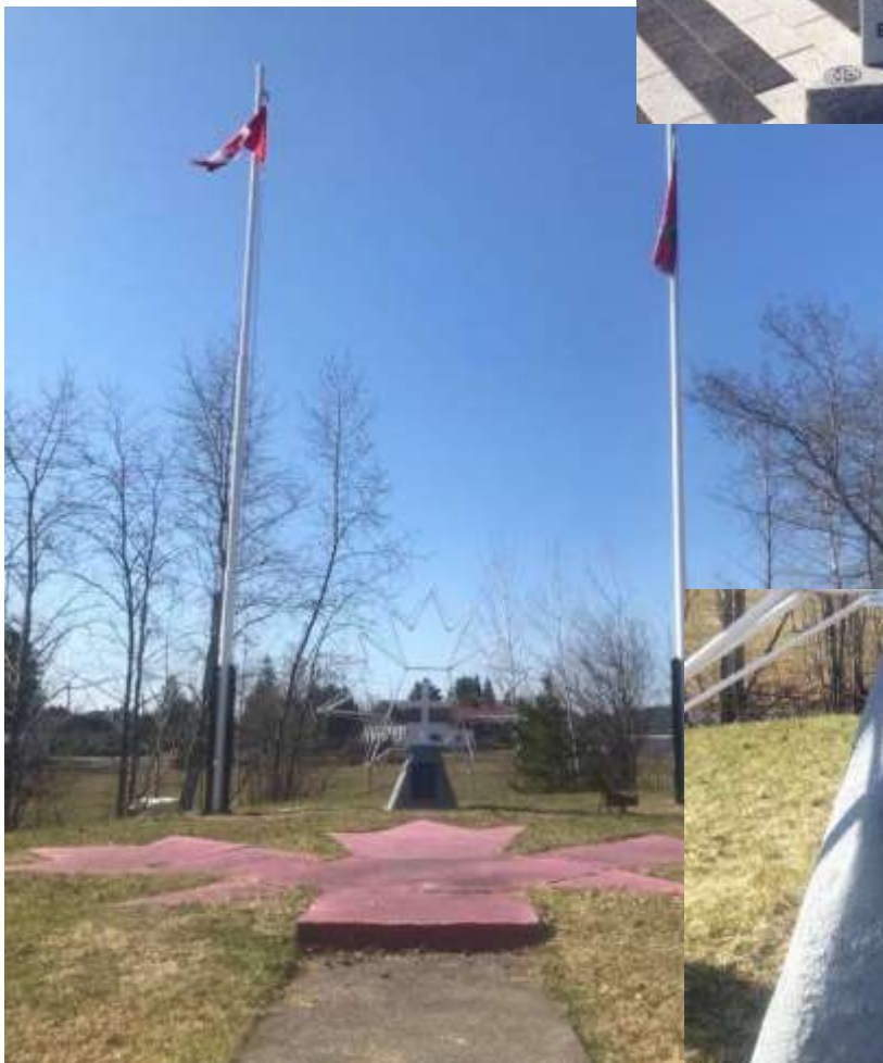
Monument met de namen van alle gesneuvelde militairen van Latchford.