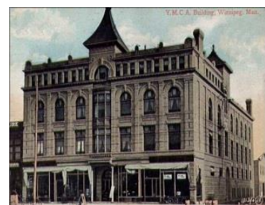
YMCA gebouw Winnipeg, Manitoba