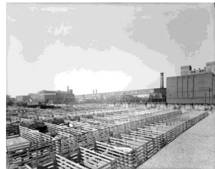
Canada Packers stock yards, south-west corner of Keele Street and St.Clair Avenue West.