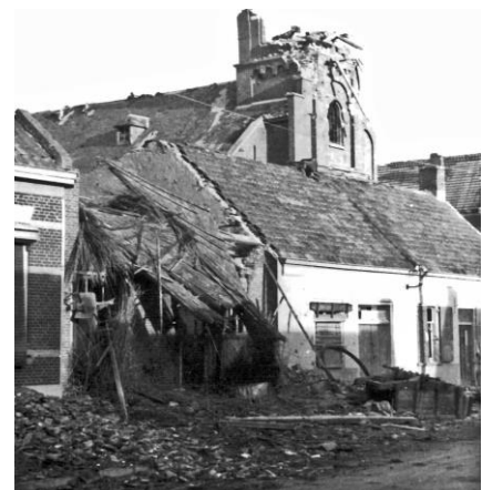
Kerk van Woensdrecht

De slag om het Rijnland (operatie Veritable en Blockbuster) is voor William helaas fataal afgelopen.