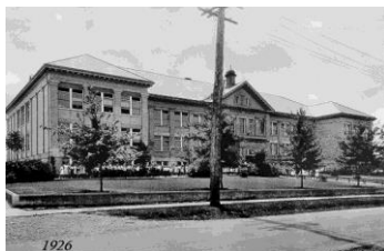
Norquay Elementary School 1926