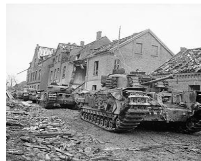
Churchill tanks rijden in een vernielde straat in Kleve - Duitsland

Alle doelen van het bataljon werden behaald en er werden maatregelen genomen tegen eventuele tegenaanvallen.